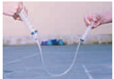
Guerra de jeringuillas.

En dos jeringuillas de diferente diámetro se introduce agua hasta la mitad y se unen con un tubo, teniendo cuidado de que no quede aire en su interior. Al empujar el émbolo de una, el émbolo de la otra es expulsado. Si dos personas empujan las jeringuillas a la vez ¡«gana» el que tiene la jeringuilla más pequeña!, porque con la misma fuerza consigue mayor presión, al ser la superficie menor.