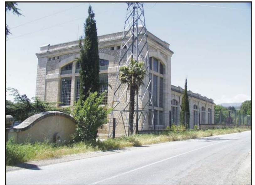
Figura 45: Central hidroeléctrica de Santa Lucía.