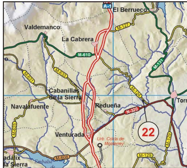
Figura 44: Situación del PID 22.