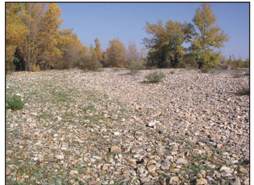
Figura 49: En el cauce del Jarama.