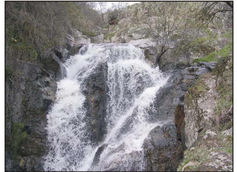
Figura 55: Cascada de la Carguera.