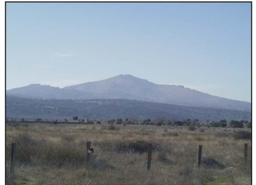
Figura 65: Cerro de San Pedro.