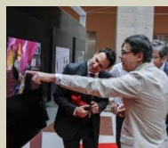
Exposición de las mejores fotografías periodísticas