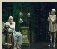
Del coro gánster a los valeses en el Teatro Salón Cervantes