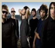
Aury, Vetusta Morla y Hombres G en Azuqueca