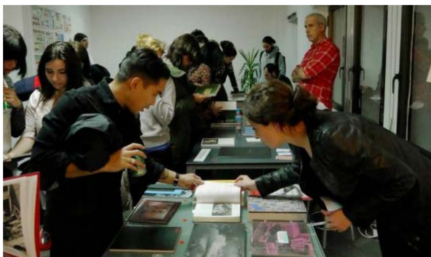
Varias personas observan fotolibros en el certamen FIEBRE.

Archivado en: Museo Reina Sofía Círculo Bellas Artes Exposiciones temporales Innovación Fotografía ESA Madrid Política científica Comunidad de Madrid Museos Exposiciones