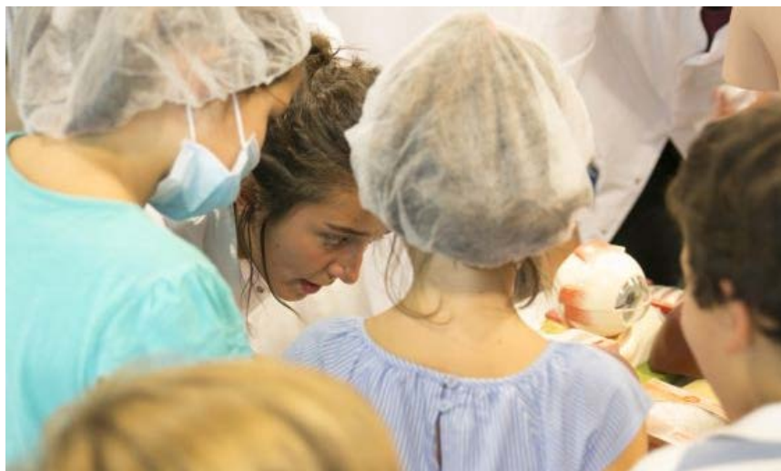
Varios niños asisten a un taller en la Fundación Telefónica.

Archivado en: i+d Investigación médica Fundación Telefónica Bioquímica i+d+i Telefónica Química Comunidad de Madrid Política científica Fundaciones