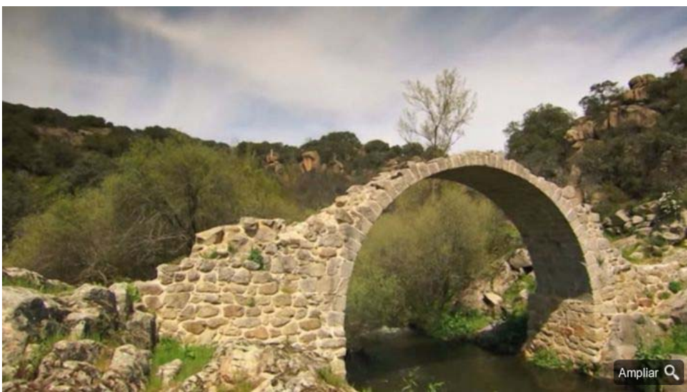
Puente de Alcanzorra