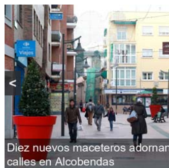
Diez nuevos maceteros adornan las calles en Alcobendas