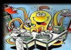
Como eres realmente