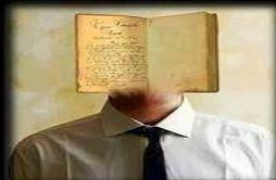
Como te ven tus amigos