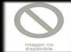
Como te ve la sociedad