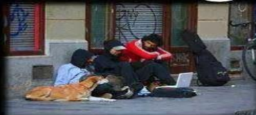
Como te ven tus padres