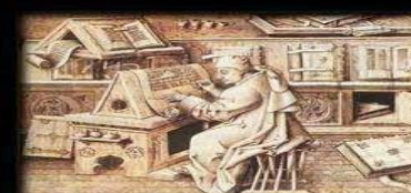
Como te ves tú mismo