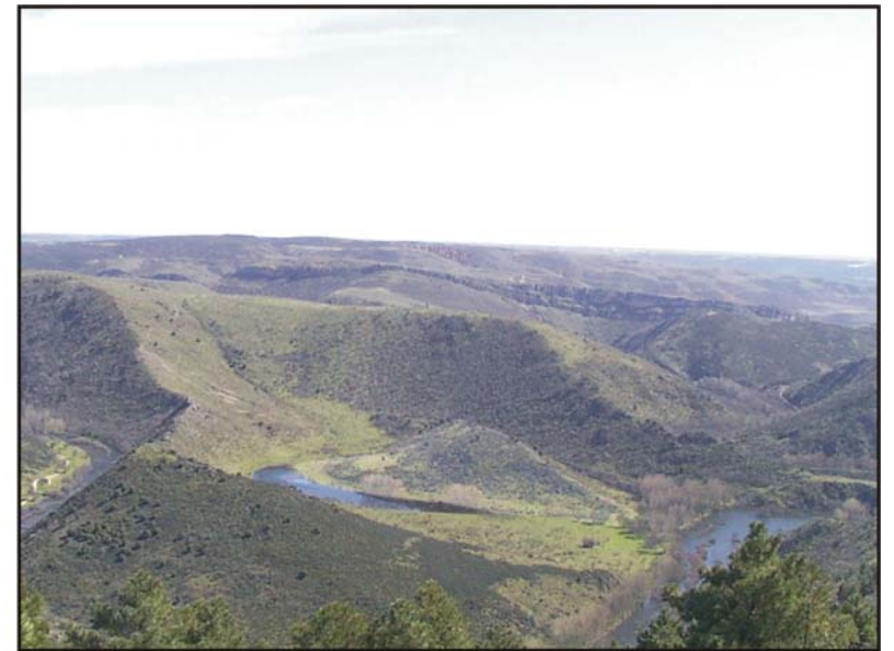
Figura 23: Meandro abandonado del río Lozoya.