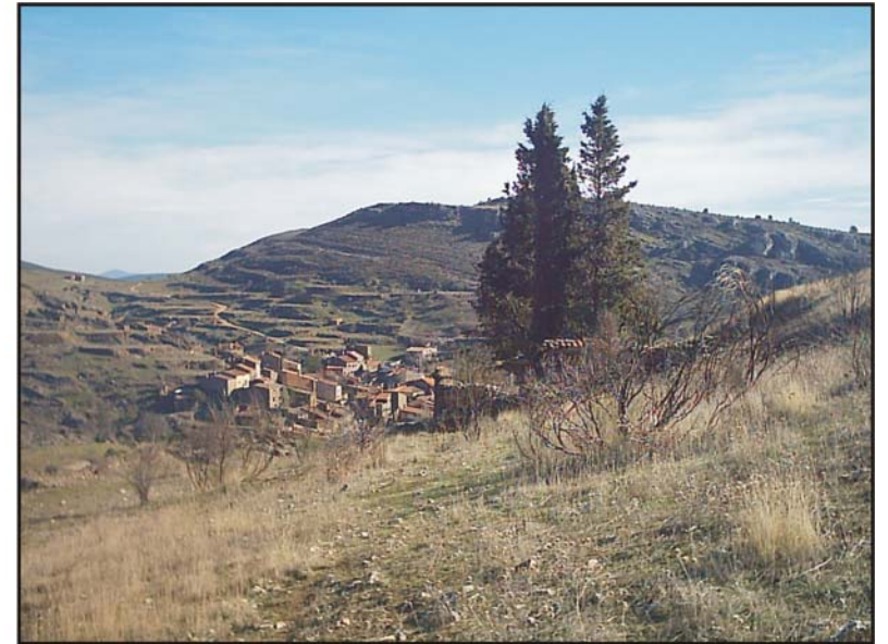
Figura 37: Cementerio de Patones de Arriba.