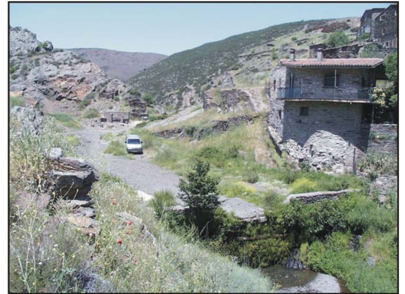
Figura 39: Presa colmatada de Patones de Arriba.