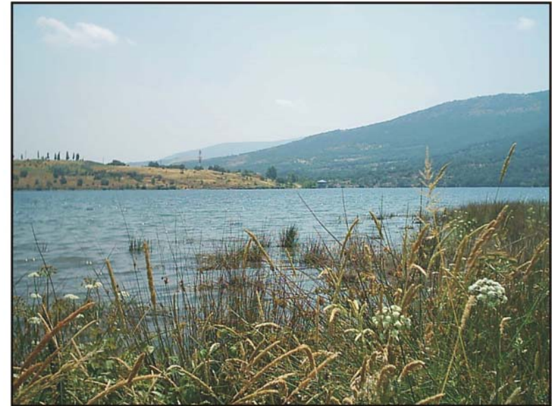
Figura 5: Embalse de Pinilla.