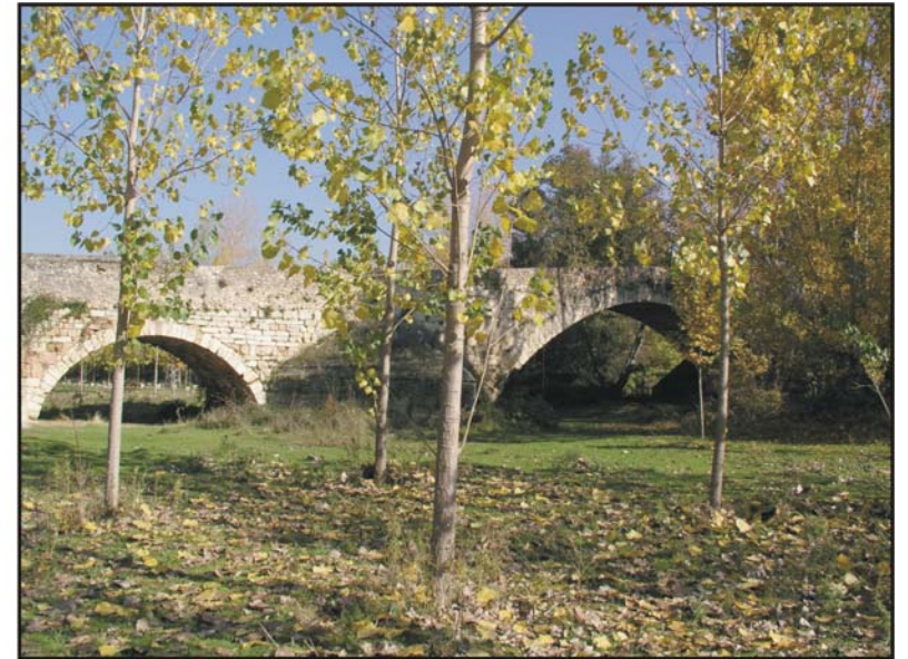
Figura 51: Puente Romano de Tamanca del Jarama.