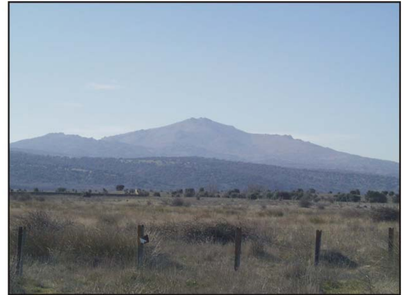
Figura 65: Cerro de San Pedro.