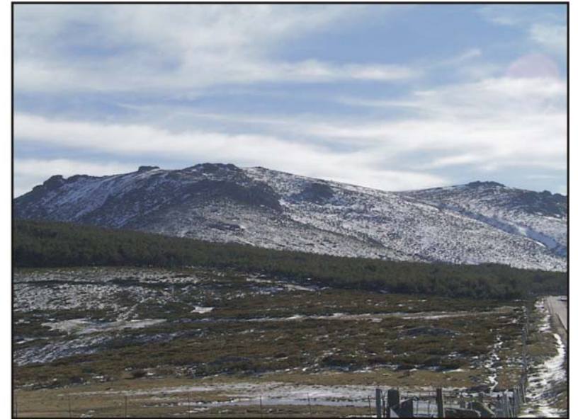
Figura 69: Cerro de Najarra.