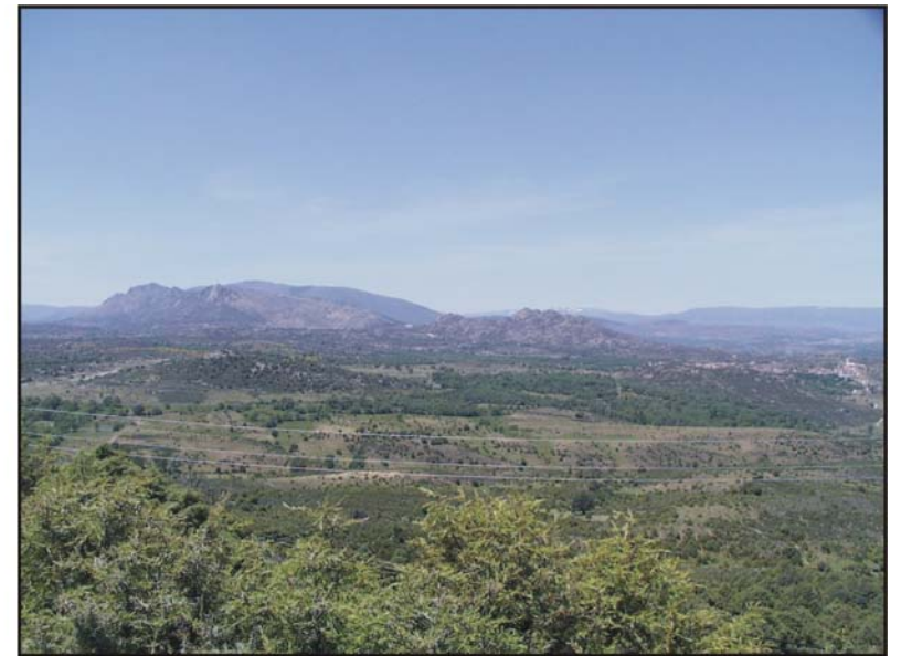
Figura 19: Proximidades de la Atalaya del Berrueco.